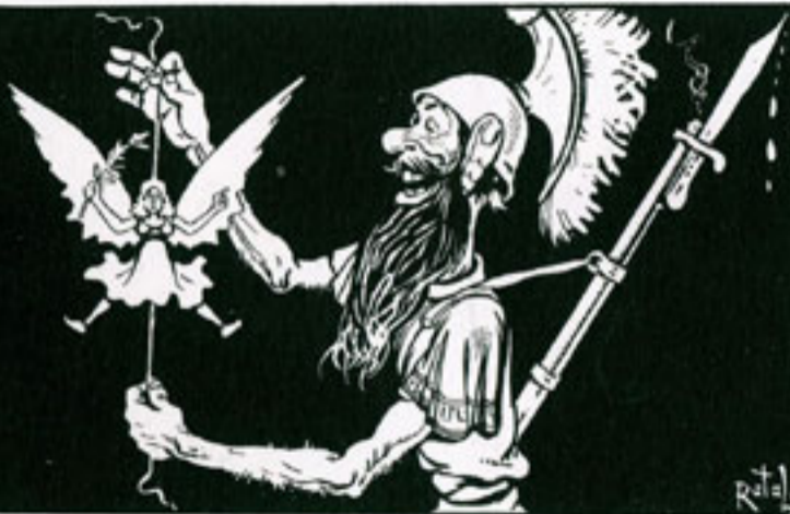
Krieg und Frieden.