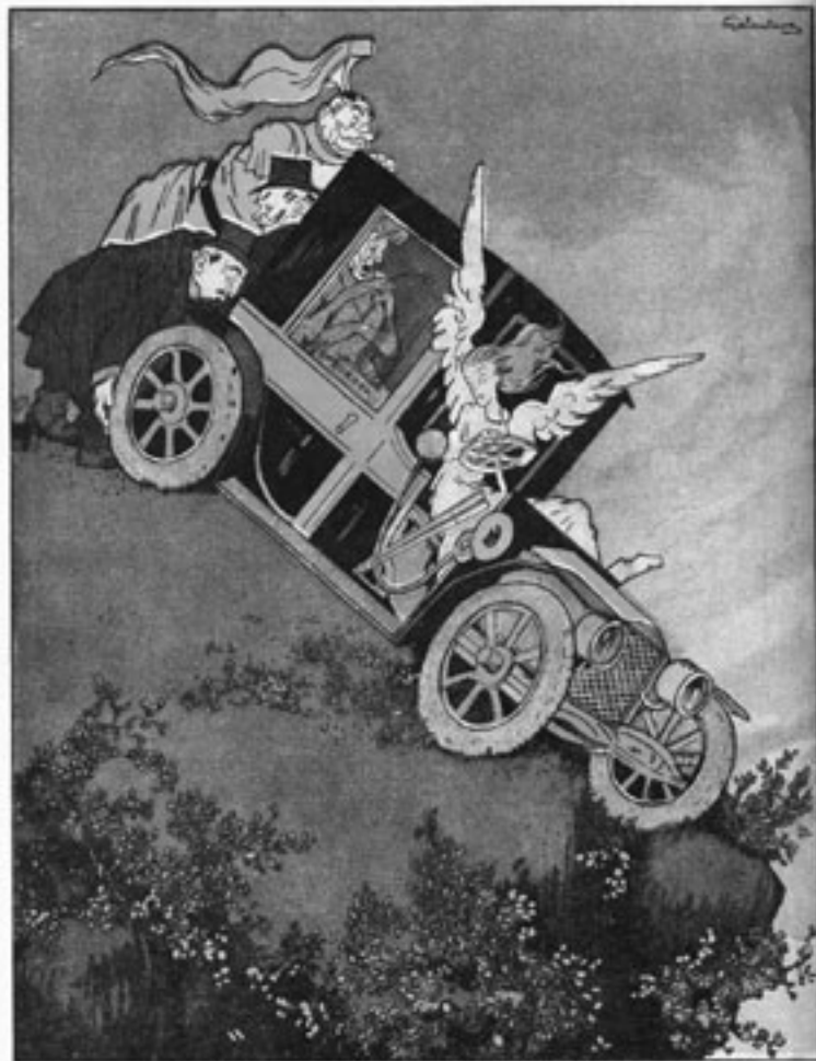
„Wem's wady und gings, wüßte bad Qute in den Wägnen!“